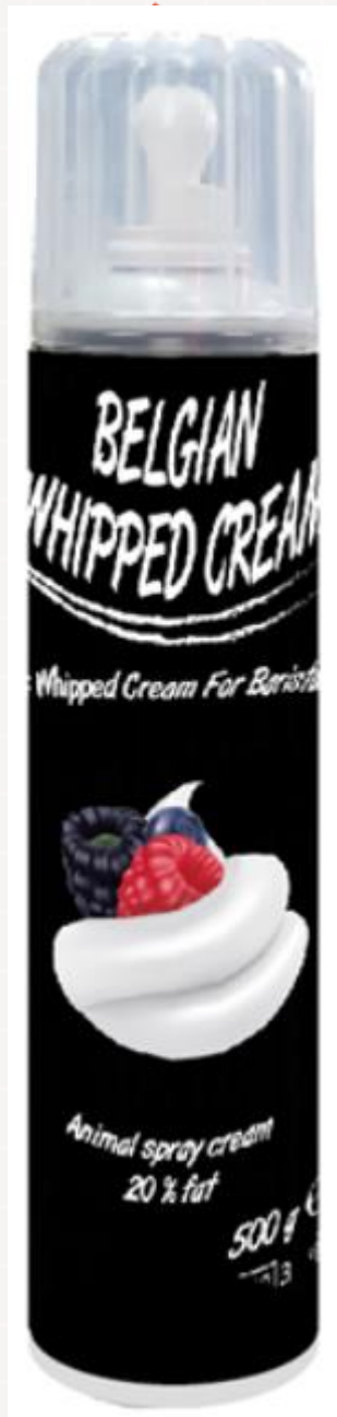
벨지안 휘핑 크림 유크림 함량 89% 동물성 지방 (조지방) 20% 벨기에 수입 제품