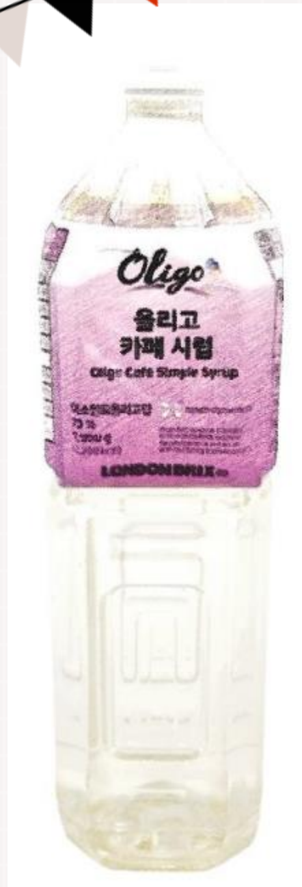
올리고 카페 시럽 이소말토 올리고당 70%