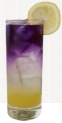
군청색에서 핑크색으로 점차 색깔이 변하는 색다른 블루멜로우 레몬에이드