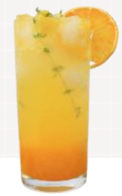
2024 k푸드 트렌드! 단호박식혜베이스에 얼음과 물만으로 간단하게 만드는 제주 한라봉 에이드