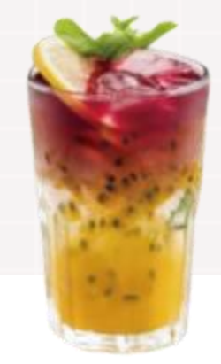
비타민의 보고, 히비스커스의 향와 패션후르츠의 상큼함이 살아 있는 히비스커스 패션후르츠 에이드