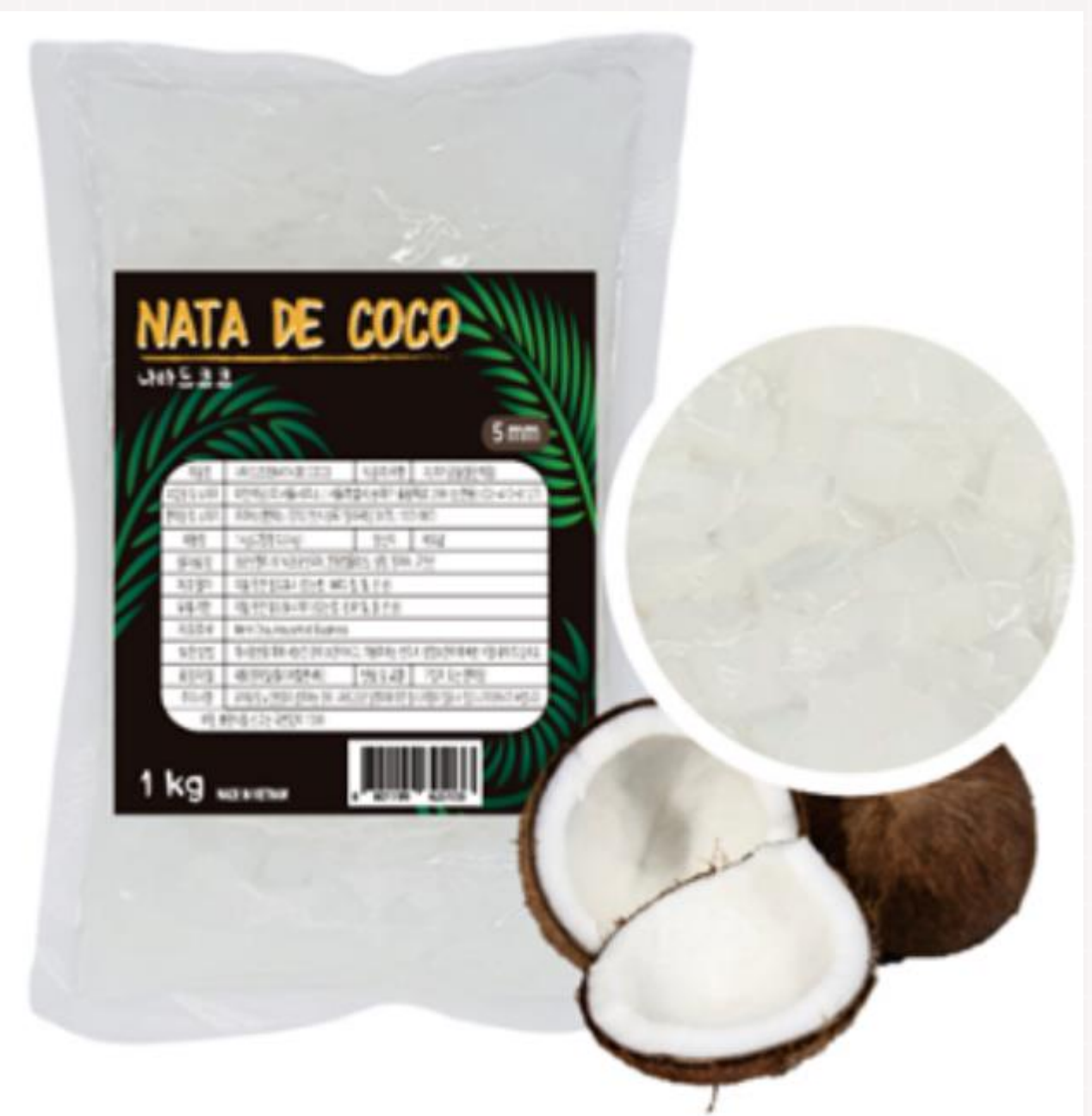
나타드 코코 코코넛젤리 80% 함유 베트남 수입 제품