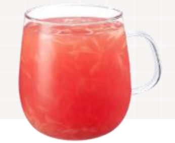
루비자몽 원팩을 간단하게 전자 렌지에 돌려 간편하게 만드는 루비 자몽티