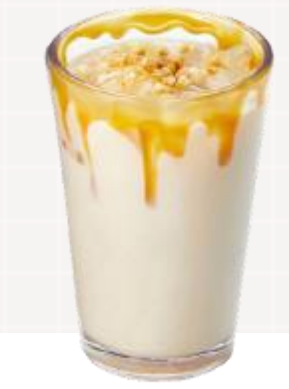
2024 k푸드 트렌드! 단호박식혜베이스에 얼음과 물만으로 간단하게 만드는 우도 땅콩라떼