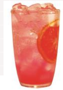
따르기만 하면 되는 주스 원팩에 자몽 sac이 알알이 살려 툭툭터지는 식감 루비 자몽주스