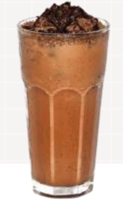
2024 k푸드 트렌드! 단호박식혜베이스에 얼음과 물만으로 간단하게 만드는 피넛 초코라떼