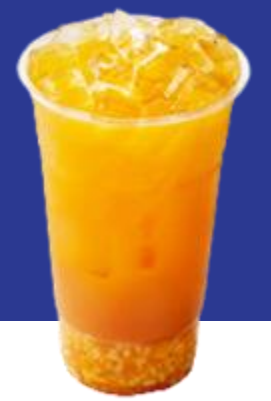
2024 k푸드 트렌드! 단호박식혜베이스에 얼음과 물만으로 간단하게 만드는 단호박 식혜