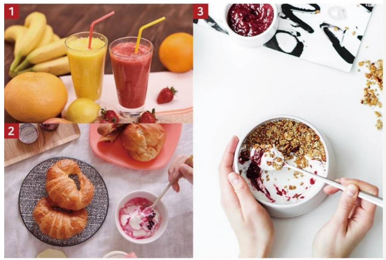
1 스무디, 에이드 등의 셰이크 음료베이스 2 베이커리 재료 및 드레싱 소스 3 빙수, 아이스크림, 요거트 등의 토폱 재료

높은 원물 함량 진한 베이스에 과일 원물이 그대로 살아있어 천연과일의 맛과 향을 풍부하게~