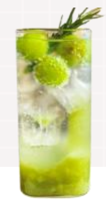
샤인머스켓 과즙과 과육을 살려 진하고 달콤한 샤인머스켓 에이드