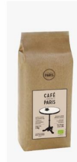
카페 빌드 파리