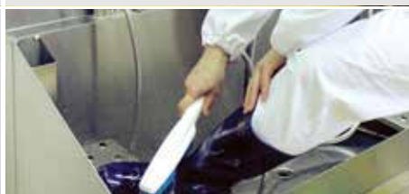
⑤ 위생솔로 위생화 세척