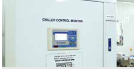
⑤ 급속냉각 과정