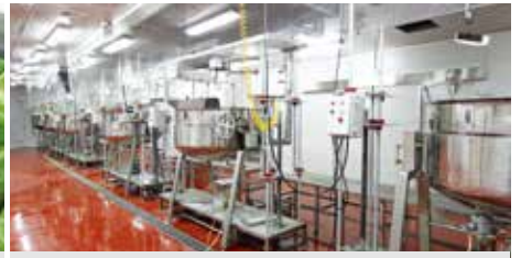
③ 조리 과정