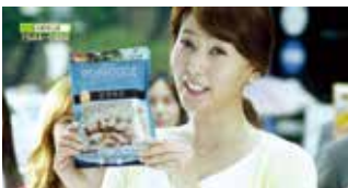
'서울마음죽' 공중파 TV 및 라디오 광고