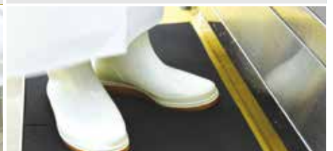
⑥ 발 소독기 위에서 위생화 바닥 소독