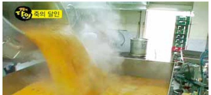
SBS '생각의 달인' - '죽의 달인' 편 방영