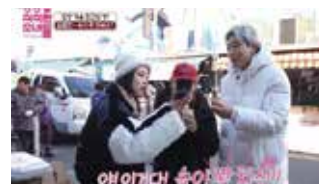
E채널 - 식식한 소녀들