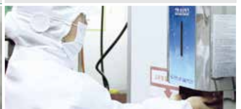
⑨ 에어샤워 후 손소독 실시

HACCP(식품 및 축산물 안전 관리인증기준) 기준에 맞는 설비로 관리되며 설비뿐 아니라 모든 작업자들이 HACCP 기준에 맞는 습관 및 의식을 갖추기 위해 정기적이고 철저한 교육을 시행하여 작은 규칙 하나도 깬다면 생산에 임하고 있습니다.