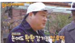
MBC - 공복자들