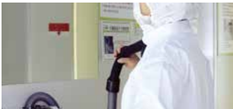
① 흡입기를 사용하여 이물질 제거