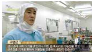
KBS 똑똑한 소비자리포트 - HACCP모범업체