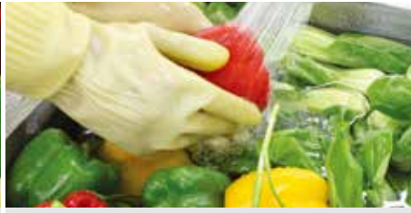
② 전처리 과정