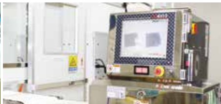
② 금속검출기, X-Ray 기계