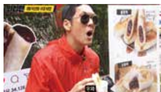
유튜브 - 외섭맨