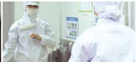
③ 거울을 통해 롤러로 이물질 제거