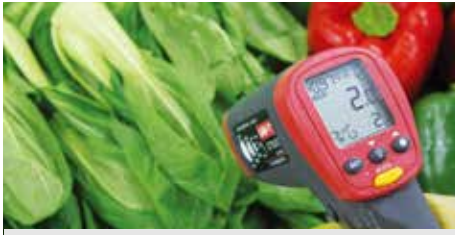
① 식재료 검수