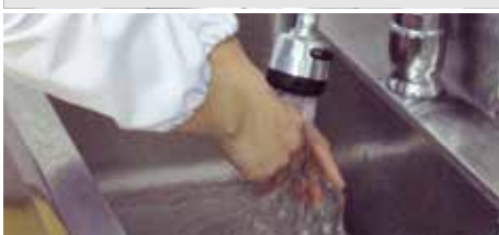
⑦ 흐르는 물에 액상 비누로 손 세척