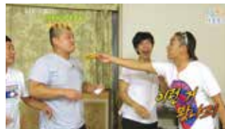
KBS 2TV - 1박2일