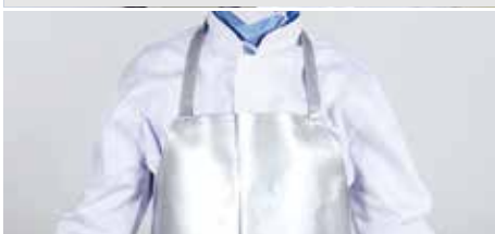
④ 살균소독된 앞치마 착용