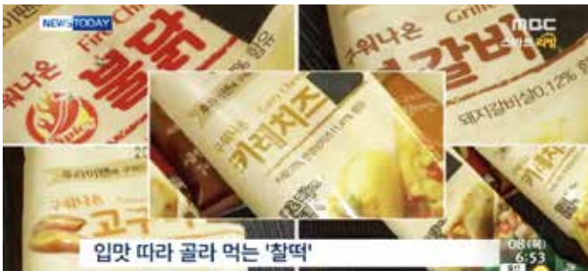
MBC '뉴스투데이' - '맛·영양잡은 이색야식' 소개