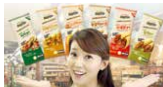
'오감찰바' 공중파 TV 및 라디오 광고