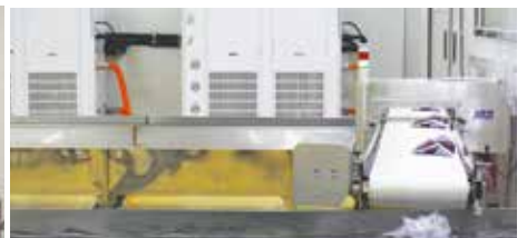
③ 자동 급속 수냉 기계