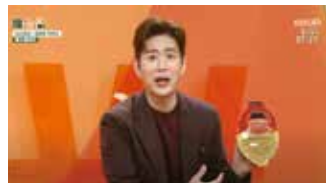
KBS2 - 해 불만한 아침 M&W