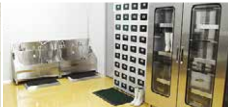
② 위생 전실: 위생화 착용