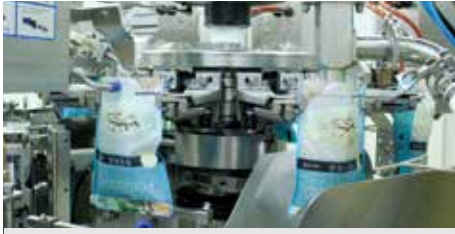
④ 포장 과정