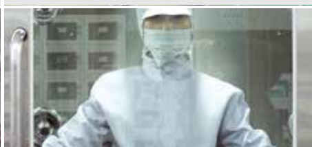
⑧ 청정 제트 에어로 의복의 미세먼지 제거