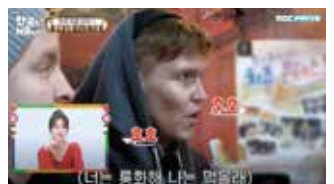
MBC - 어서와 한국은 처음이지