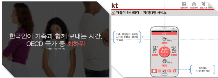
▲ 산학협력시 IBS에서 제안한 내용