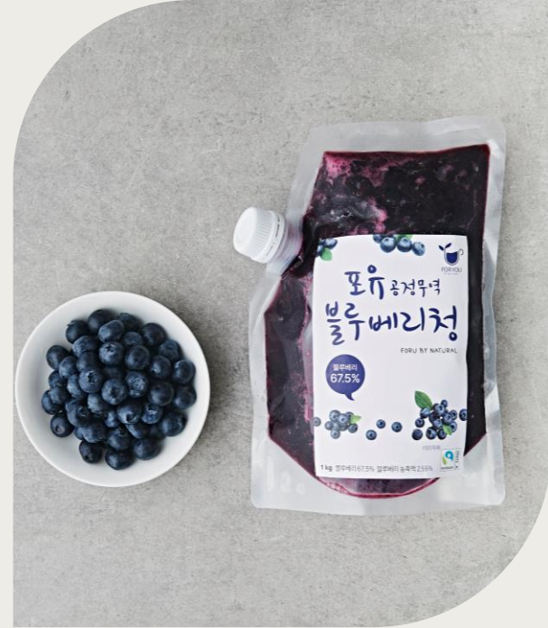
블루베리청 1kg (블루베리 67.5%, 미국산)