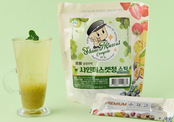
샤인머스캣청 (샤인머스캣 47% 국산)