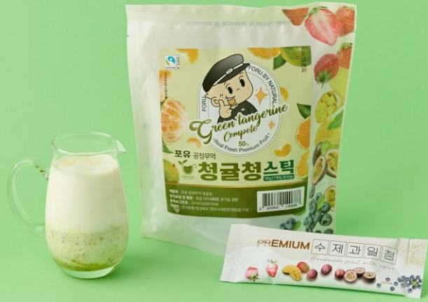
청귤청 (청귤 50%, 국산)