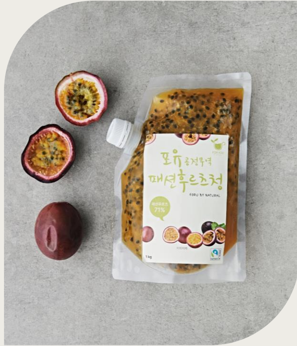
패션후르츠청 1kg (패션후르츠 71%, 베트남산)