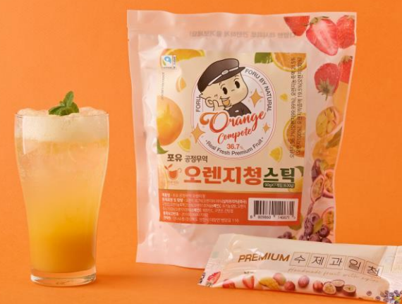
오렌지청 (오렌지 36% 남아프리카공화국)