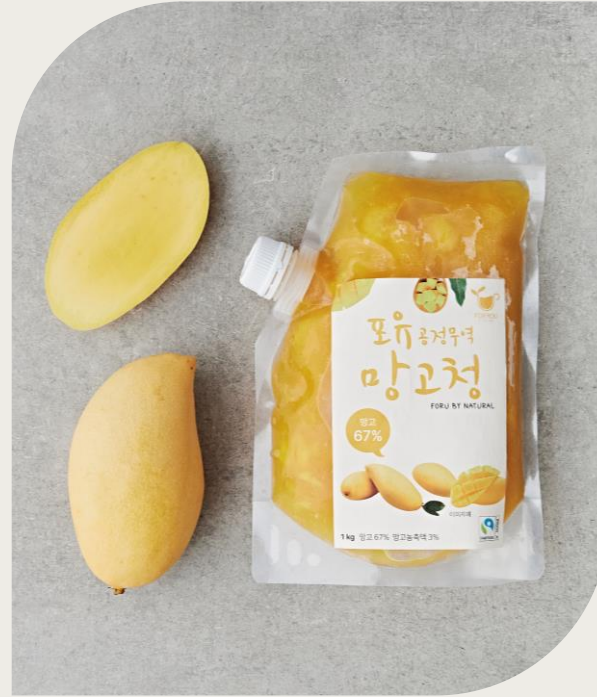
망고청 1kg (애플망고 67%, 페루산)