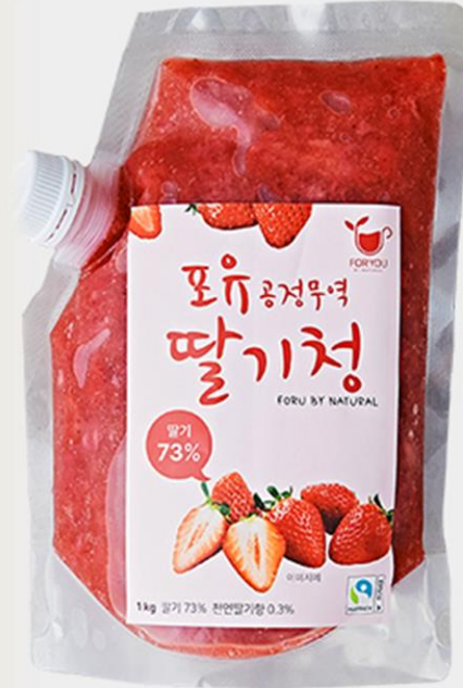
포유 공정무역 과일청 1kg