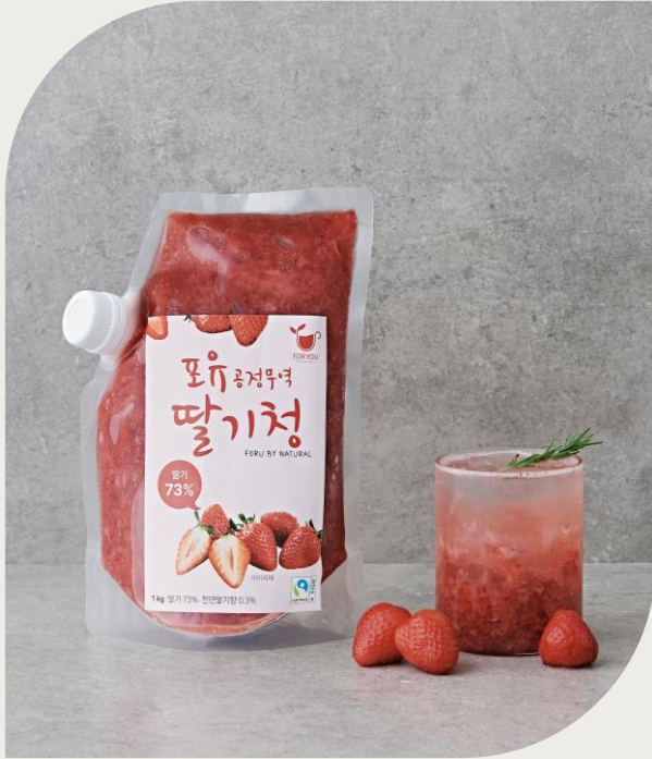
딸기청 1kg (딸기 73%, 국산)