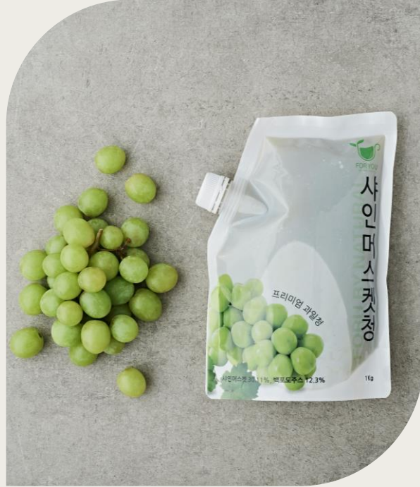
샤인머스캣청 1kg (샤인머스캣 30%, 국산)