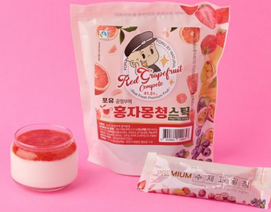
자몽청 (홍자몽다이스 30% 남아프리카공화국)