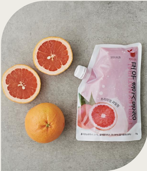
자몽청 1kg (홍자몽다이스 30%, 남아프리카공화국)