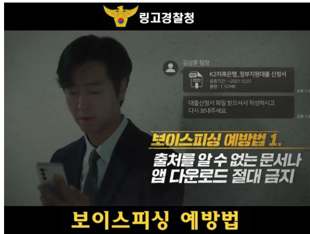
사례1_ 제작영상을 V링고에 저장~

인터넷에서 봤던 영상이 여기도 나오네?! 신뢰감이 더 생기는걸~ 열심히 홍보하는거 보니 피해자가 많나봐! 나도 조심해야겠어!