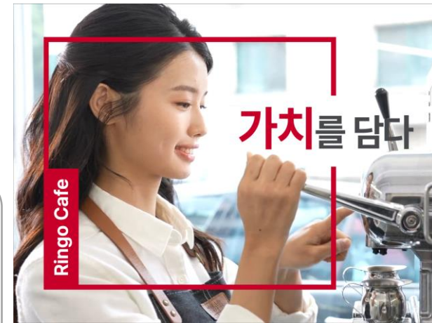
사례2_ 제작영상이 없어도 가능한 브랜딩광고

요즘 젊은이들은 가치소비를 중시한다지?.. 우리회사도 사회적 가치를 고려해 서 자연친화적인 상품을 만들어 신 뢰를 쌓고 있는데, 이 사실을 알린 다면 브랜드 가치가 더 올라갈거야!