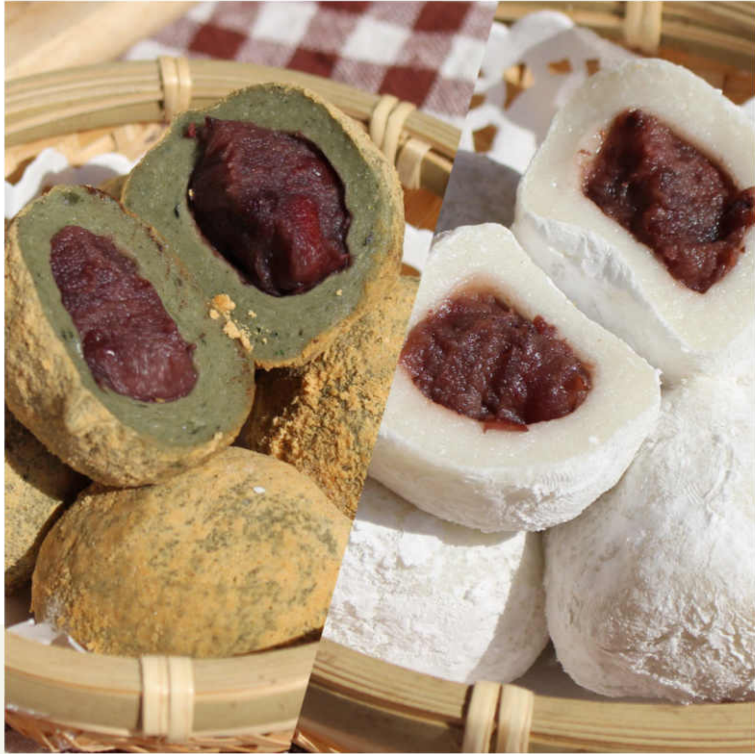
콩숙찰떡 / 찰쌀떡

쫄깃한 찰쌀떡 안에 팔 앙금을 듬뿍 넣은 대한민국 대표 간식 떡 기본맛에 충실하여 누구나 부담없이 즐길 수 있는 찰쌀떡과 향긋한 쑥가루와 고소한 콩가루가 더해져 풍미가 깊고 진한 고급스러운맛