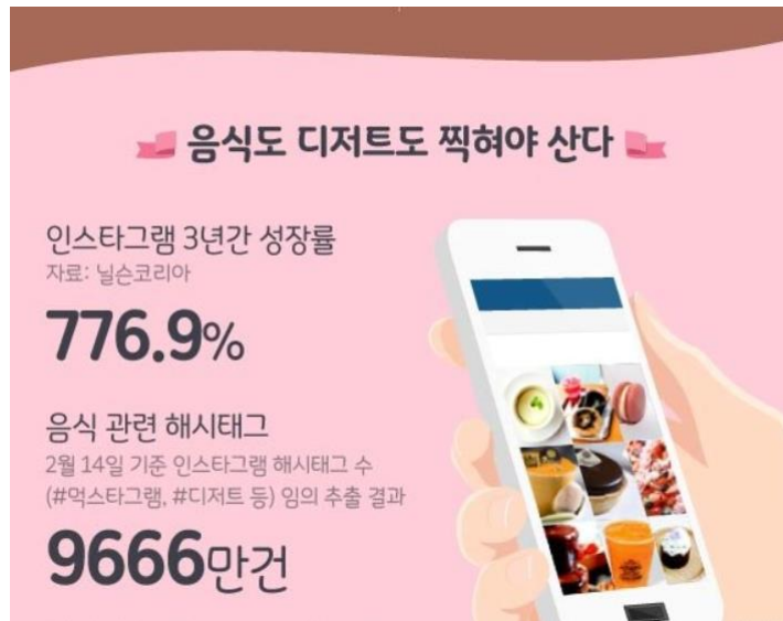
▲ 출처: 중앙일보