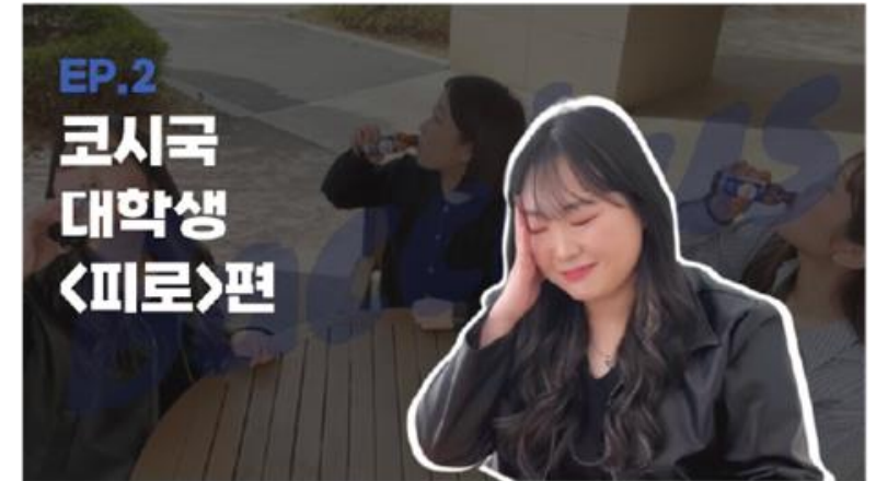
▲ 2022 동아제약 박카스 홍보 영상