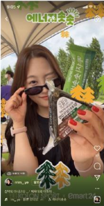
▲ 2022 이마트24 에너지 쑥쑥 릴스 챌린지

약 100명 가량의 회원이 브랜드 측에서 제시한 가이드라인(해시태그, 강조 및 지양 내용)에 따라 인스타그램, 페이스북, 블로그에 후기 업로드