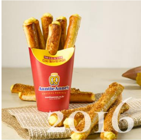
앤티앤스 프레즐 코리아 신제품 시즌 메뉴 '고구마 크림치즈 스틱', '청포도, 자몽 레몬에이드' 출시, 200호점 매장 오픈