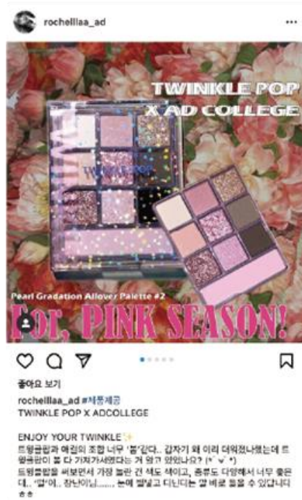
▲ 클리오 트윙클팝_인스타그램