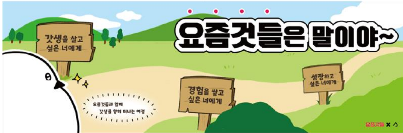
▲ 2022 요즘것들 카드뉴스