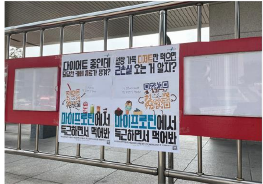
▲ 2022 마이프로틴 포스터 공모전