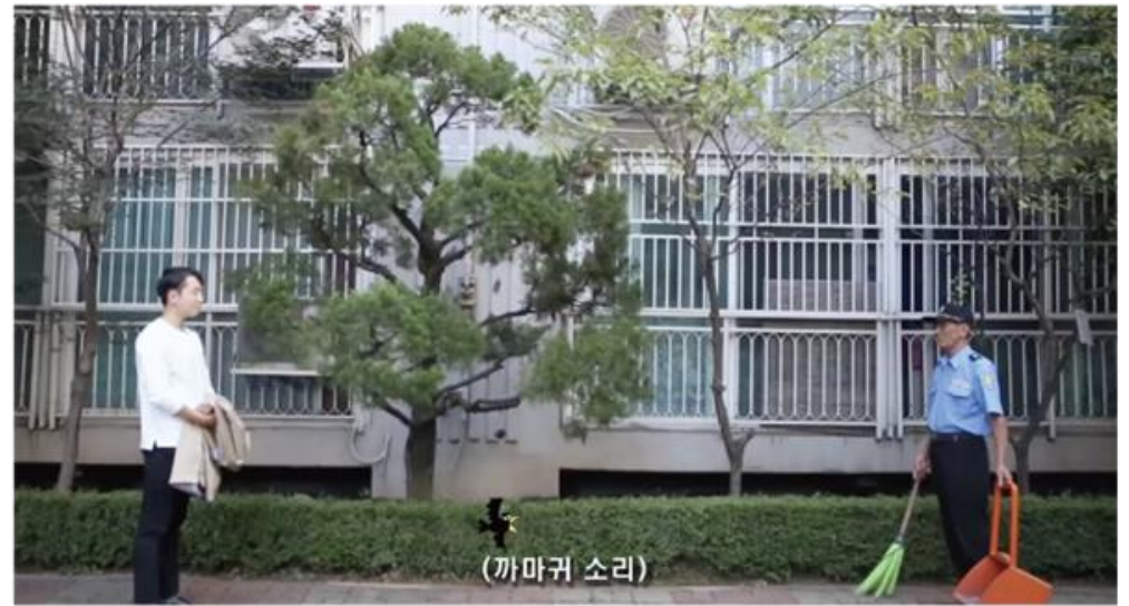
▲ 2019 애드컬리지 X 포커스 미디어 '대국민 인사 프로젝트'