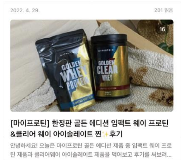
▲ 마이프로틴_네이버 블로그