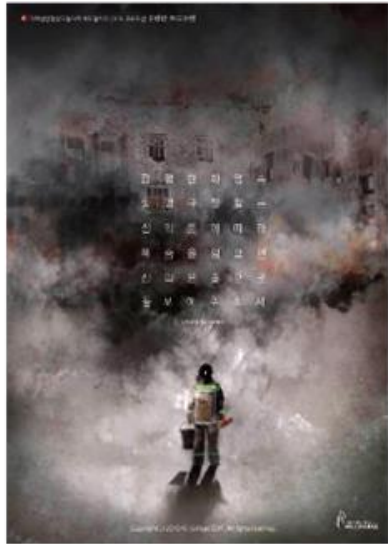
▲ 2018 애드컬리지 소방관 장비 부족 프로모션

동아리 회원이 팀을 구성하여 사회적 문제를 위한 공익 광고를 제작하고 실제 광고를 집행하거나 펀딩을 진행합니다.