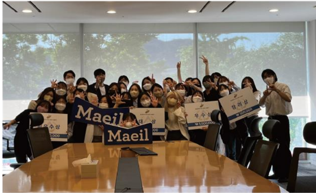
▲ 2022 매일유업 X 애드컬리지 경쟁PT

동아리 회원이 팀을 구성하여 브랜드가 제시하는 과제로 마케팅 및 광고 제안서를 작성 혹은 콘텐츠 제작을 합니다.