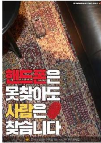
▲ 2018 애드컬리지 X 경찰청