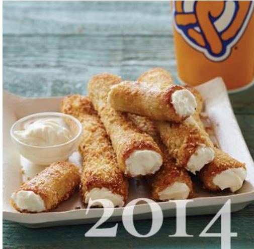
앤티앤스 프레즐 코리아 신제품 '크림치즈 스틱' 출시, 100호점 매장 오픈