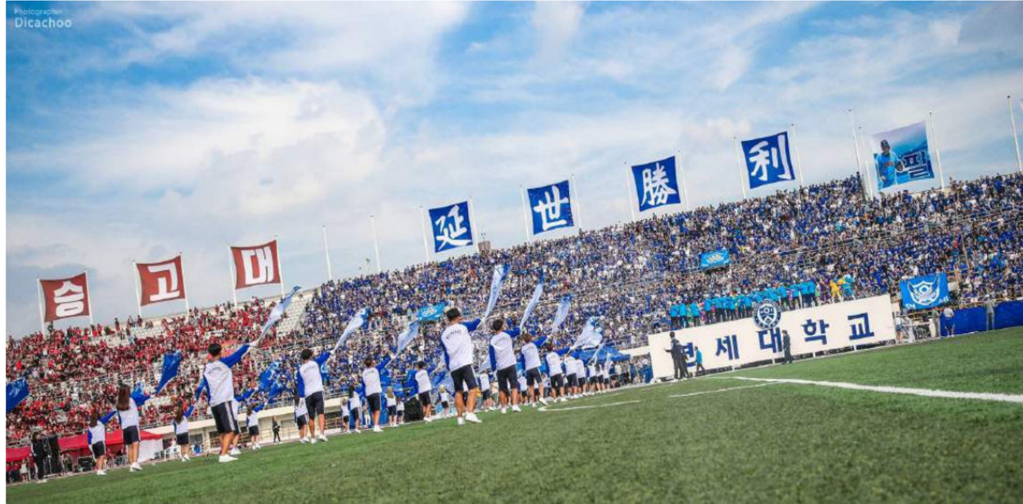
[ 9월 '정기 연고전' ]