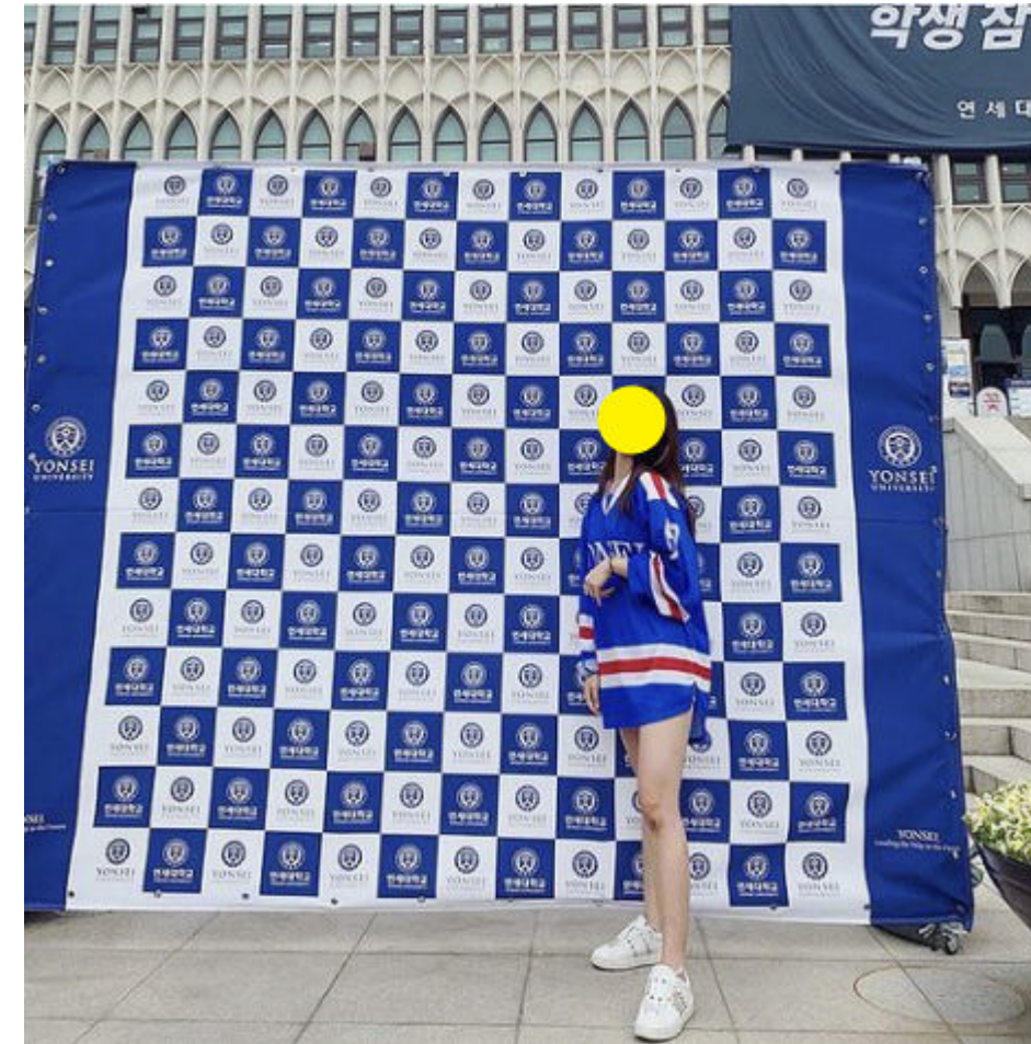
[‘아카라카를 온누리에’ 행사 당일 포토존]