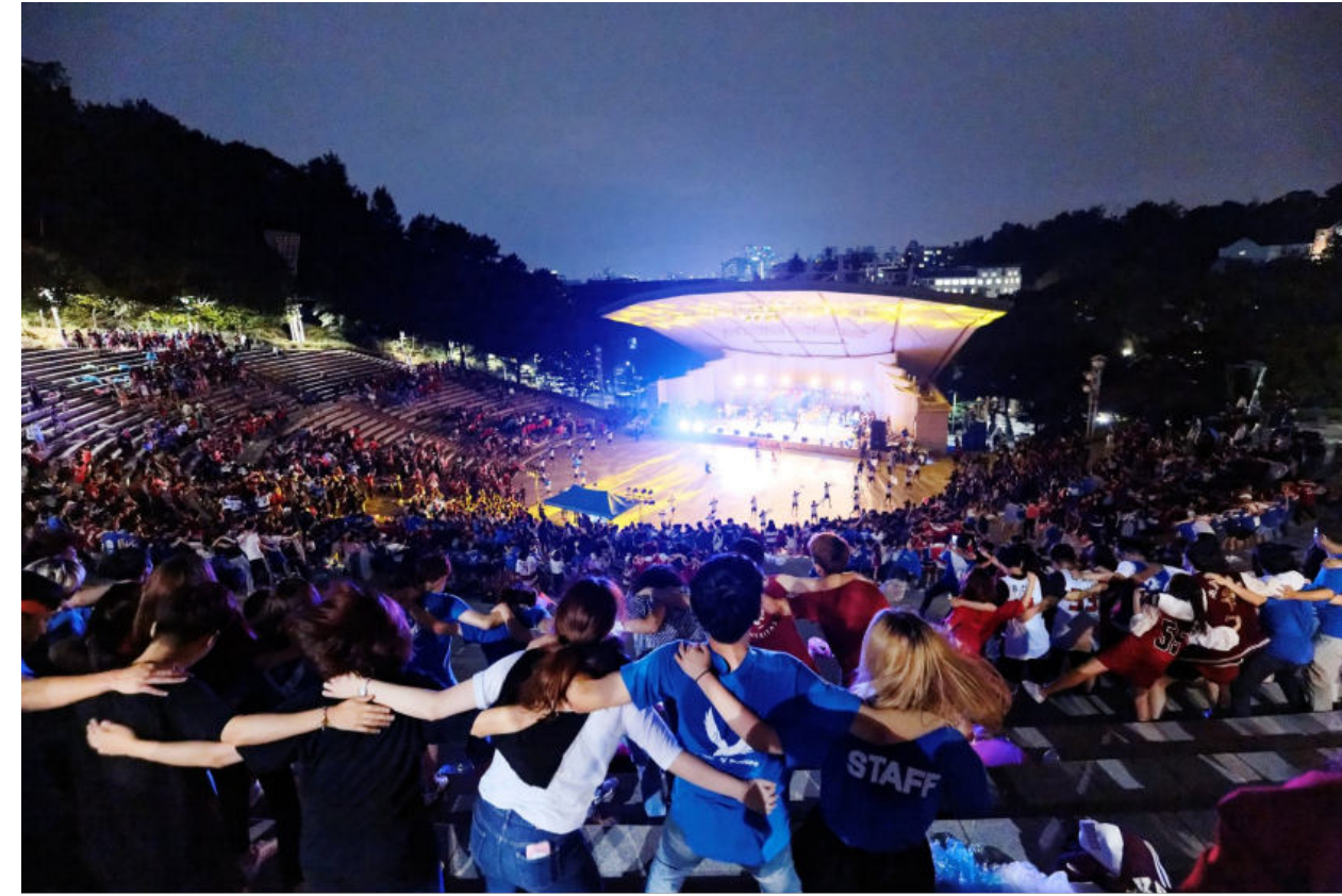
[ 하반기 행사 영상: https://www.youtube.com/watch?v=2JsV7vPhzII ]