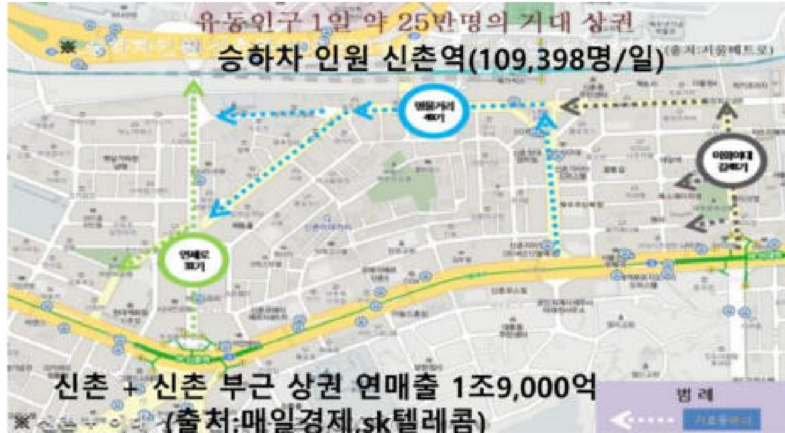
행사 당일 노천극장 및 신촌일대 유동인구 (주중 256,000명, 주말 301,000명)