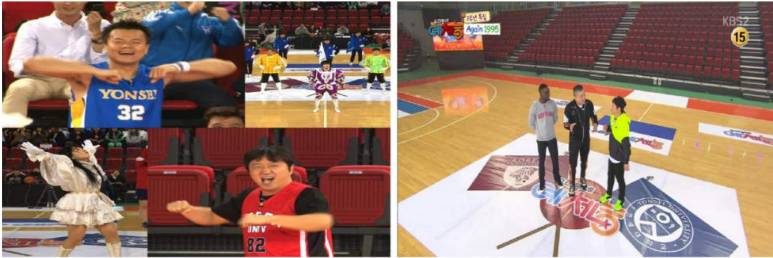
[TV프로그램 '우리동네예체능' 출연]