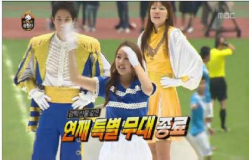
[TV프로그램 '무한도전' 출연]