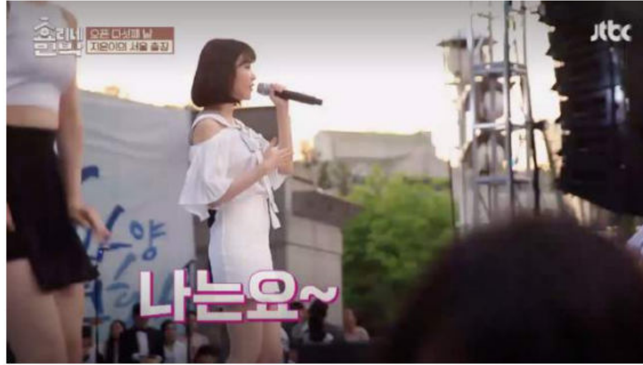
[TV프로그램 '효리네민박' 자료화면 출연]