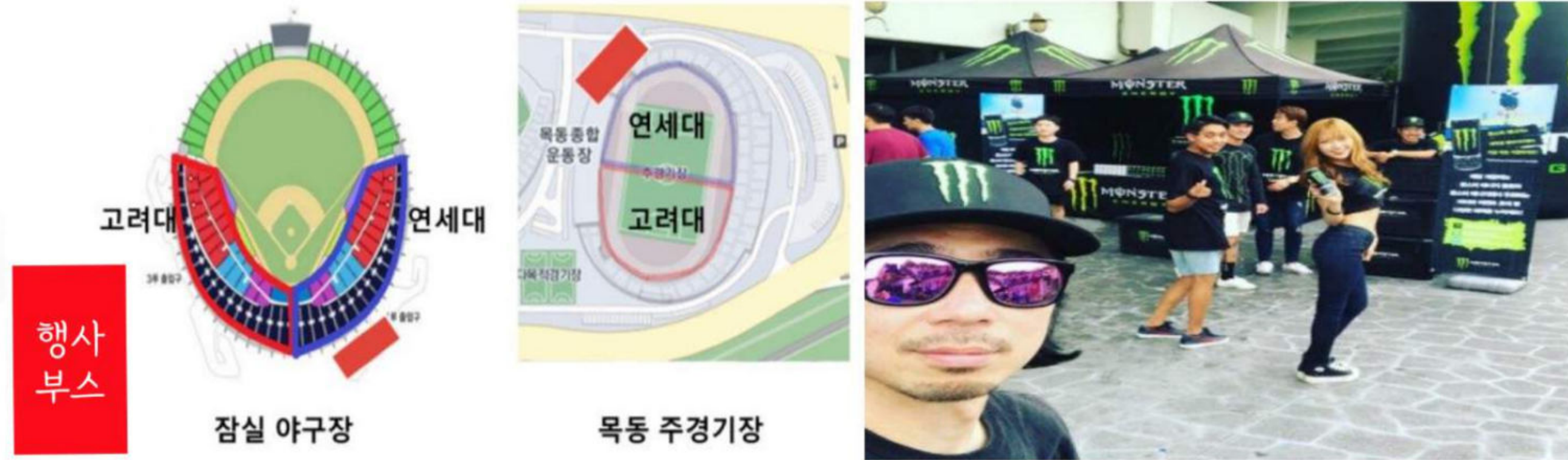
[’2017 정기 연고전’ 몬스터 이벤트 부스]