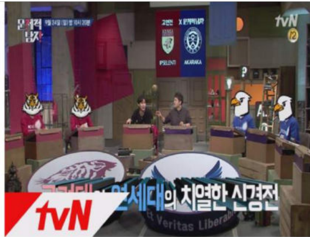
[TV프로그램 '문제적남자' 연고전관련 콘텐츠]