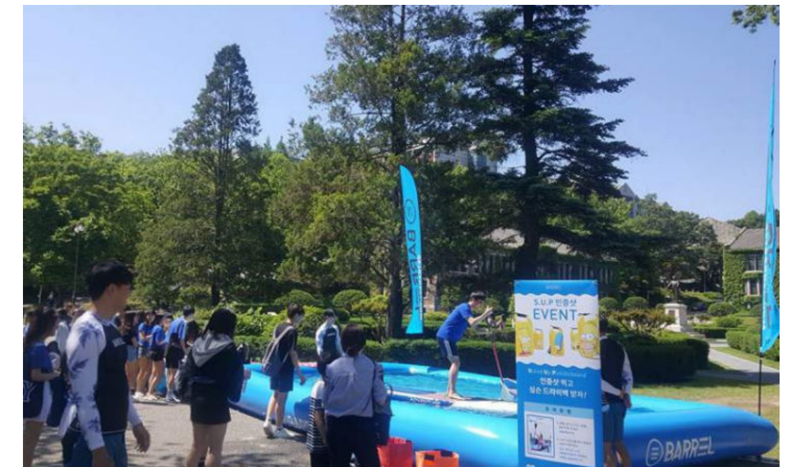
[ '2018 아카라카를 온누리에' 배럴 부스' ]