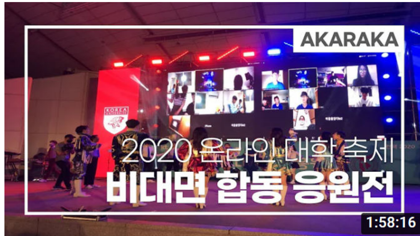
[ 2020년 온라인 합동응원전: https://www.youtube.com/watch?v=erUWfGctWx0 ]