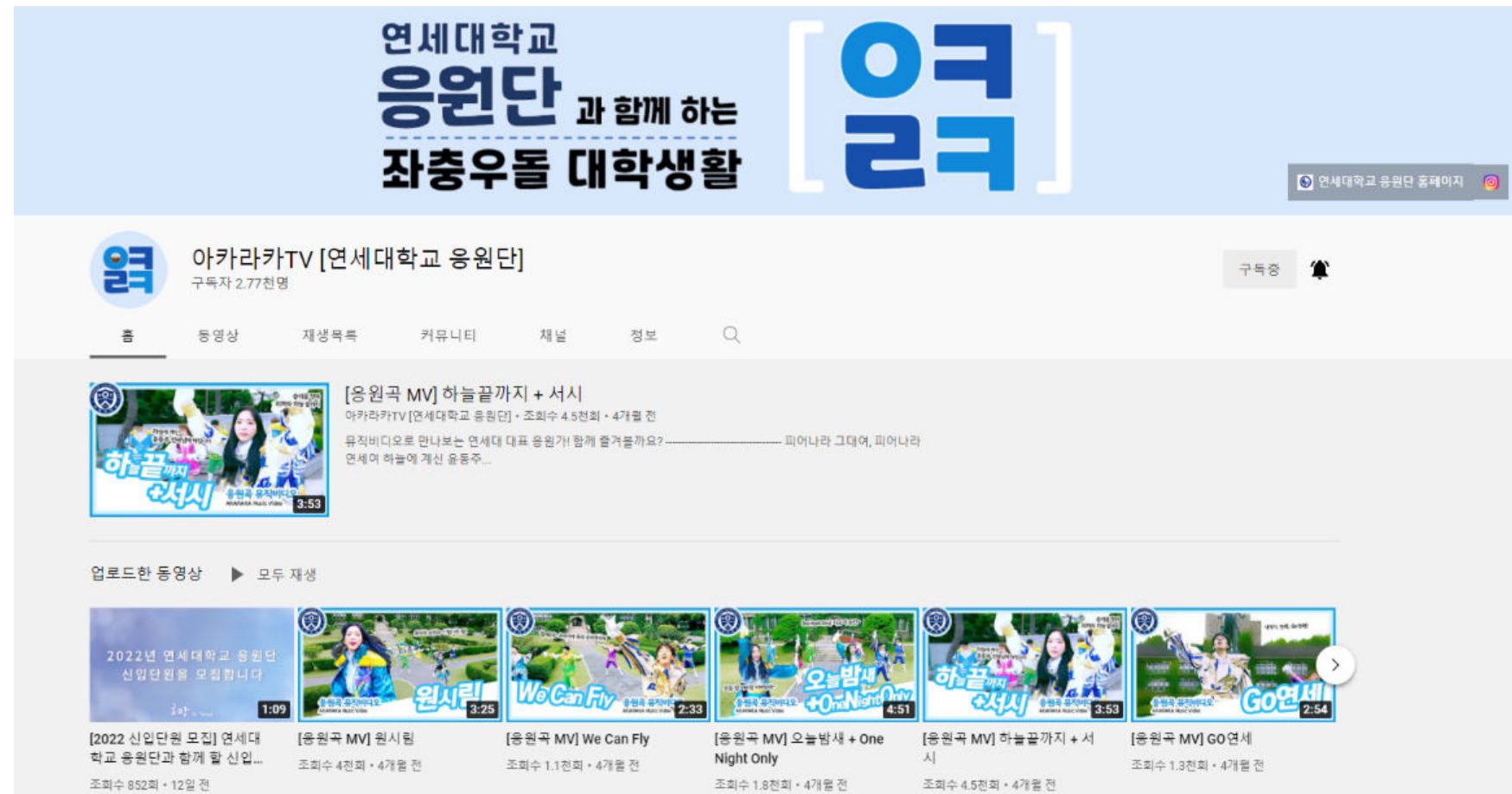
[ 연세대학교 응원단 공식 유튜브 채널 '아카라카 TV' ]