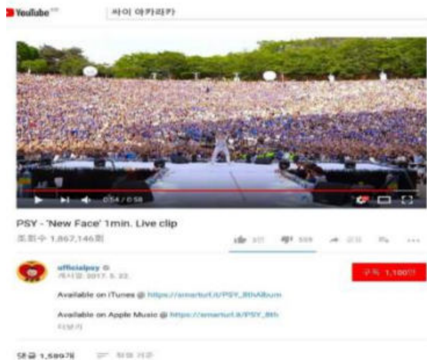
[유튜브에 업로드된 축제영상]