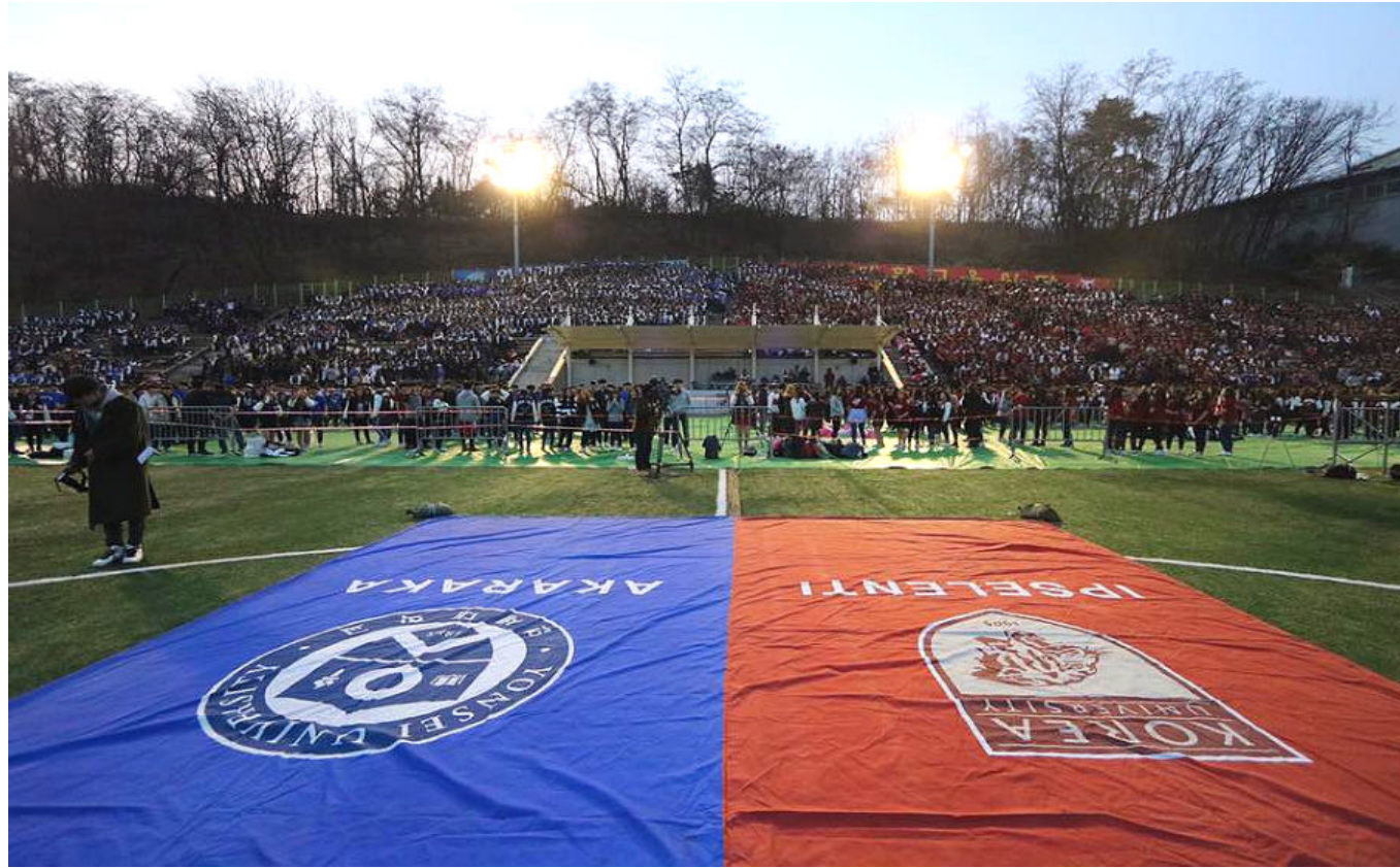
[ 상반기 행사 영상: https://youtu.be/V-HxmmkAdqA ]