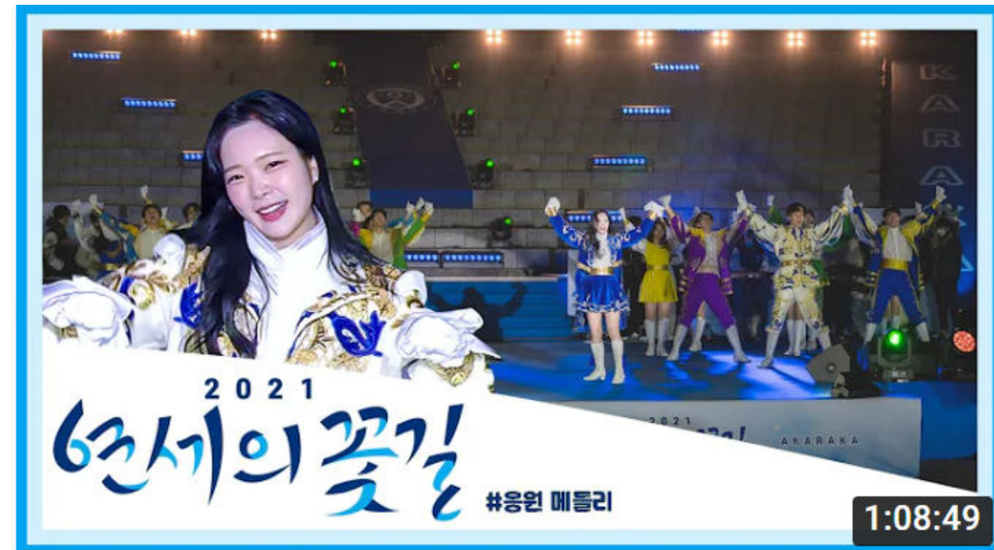
[ 2021년 하반기 행사: https://www.youtube.com/watch?v=ljktQdNmlMw ]