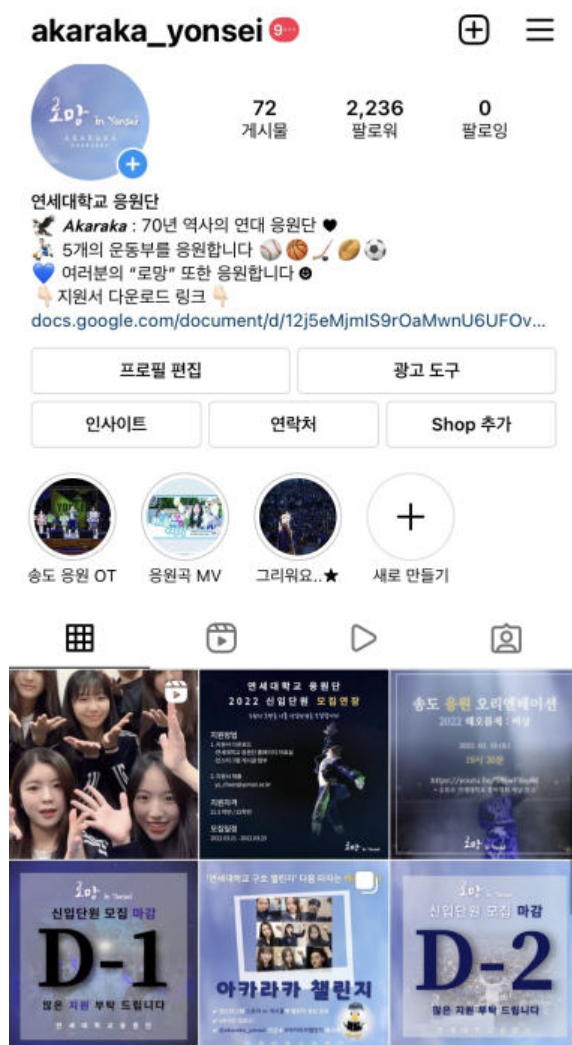
[ 연세대학교 응원단 인스타그램 페이지 ]