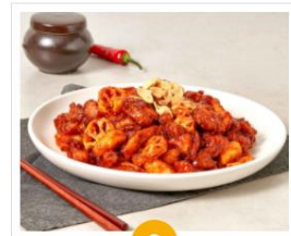
고추장 THE한 치킨