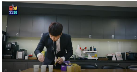
메뉴/캡슐/믹스커피 신제품을 홍보한 "이디야" 편

브랜드 인지도 구축, 신제품 홍보, 세일즈 프로모션 등 광고주의 다양한 니즈를 충족