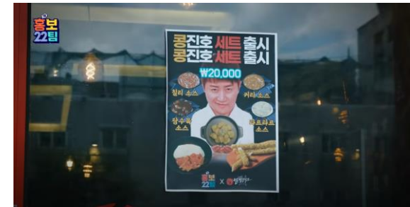
세트메뉴를 개발한 "열정분식소" 편