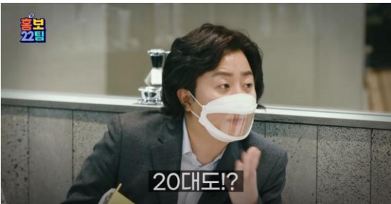
MZ세대 대상 가발 브랜드를 홍보한 "헤어수트" 편