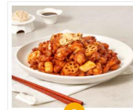
간장 THE한 치킨

실제 당면한 이슈 해결을 위한 기발하고 재미있는 솔루션 제안이 필요한 광고주