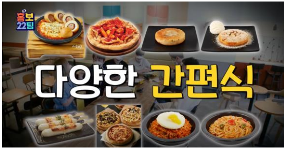
빙수에서 간편식으로 인식 확대를 위한 "설빙" 편

MZ세대 대상 브랜드/제품의 소구 포인트를 거부감 없이 재미있게 전달하고 싶은 광고주