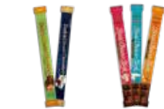
다크 & 초콜릿바(40g)(크림, 아몬드) 리얼 초코 스틱(40g)(딸기요거트, 밀크크림, 아몬드) 여러가지 맛을 입맛대로 골라먹는 재미가 있는 스틱 초콜릿(쉽게 뜯을 수 있는 easy cut 포장)