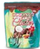
코코넛 피넛 클러스터(150g) 맛있는 코코넛과 피넛의 고소함이 가득 들어있는 초콜릿(코코넛 16%, 피넛 16% 함유)