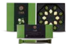
오설록 제주섬 녹차 초콜릿(120g, 128g) 청정지역 제주산 녹차 분말로 만들어진 오설록의 프리미엄 녹차 초콜릿