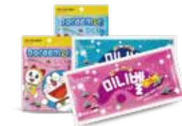
미니벨(40g) 다양한 색상의 코팅 캔디가 붙어있는 벨 모양의 초콜릿