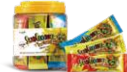
해바라기씨 초코볼(500g) 고소한 해바라기씨가 들어 있는 초콜릿으로 천연색소를 사용하여 안심하고 드실 수 있는 간식