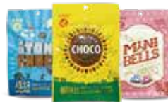
미니벨, 스톤초코, 해바라기씨초코(100g, 80g, 80g) 달콤하고 알록달록한 세가지 컨셉의 초콜릿으로 노브랜드 전용제품