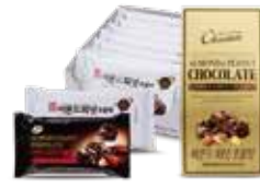
아몬드 피넛 초콜릿(80g, 100g, 500g) 고소한 아몬드와 땅콩, 달콤한 초콜릿이 어우러진 제품(아몬드 16%, 땅콩 16% 함유)