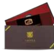
기념품 초콜릿(180g, 360g) (서울대 초콜릿/주한미 대사관/가톨릭 대학교) 다양한 모양의 구성된 선물용 초콜릿 제품으로 선물하기 좋은 고급스러운 다크초콜릿