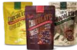
리얼 초콜릿 바크썬(260g) (다크 아몬드, 화이트 바나나, 밀크 헤이즐넛 모카) 초콜릿 속에 각종 견견과류가 듬뿍 들어있는 고급 수제형 제품