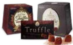
트러플(64g, 200g, 400g)(밀크, 밀크티) 초콜릿 표면에 고급 파우더링 처리가 되어있으며 입안 가득 진하고 부드러운 리얼 초콜릿