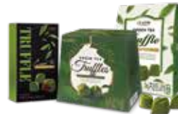
녹차 트러플(64g, 200g)(녹차, 녹차&초코) 녹차 초콜릿 표면에 녹차가루가 파우더링 되어있어 더 진한 녹차 맛을 느낄 수 있는 마일드형 초콜릿