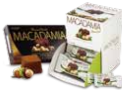
마카다미아 쇼콜라(21g, 84g) 밀크 초콜릿 셀 안에 고소한 마카다미아가 들어있는 고급 프랄린 형태의 초콜릿