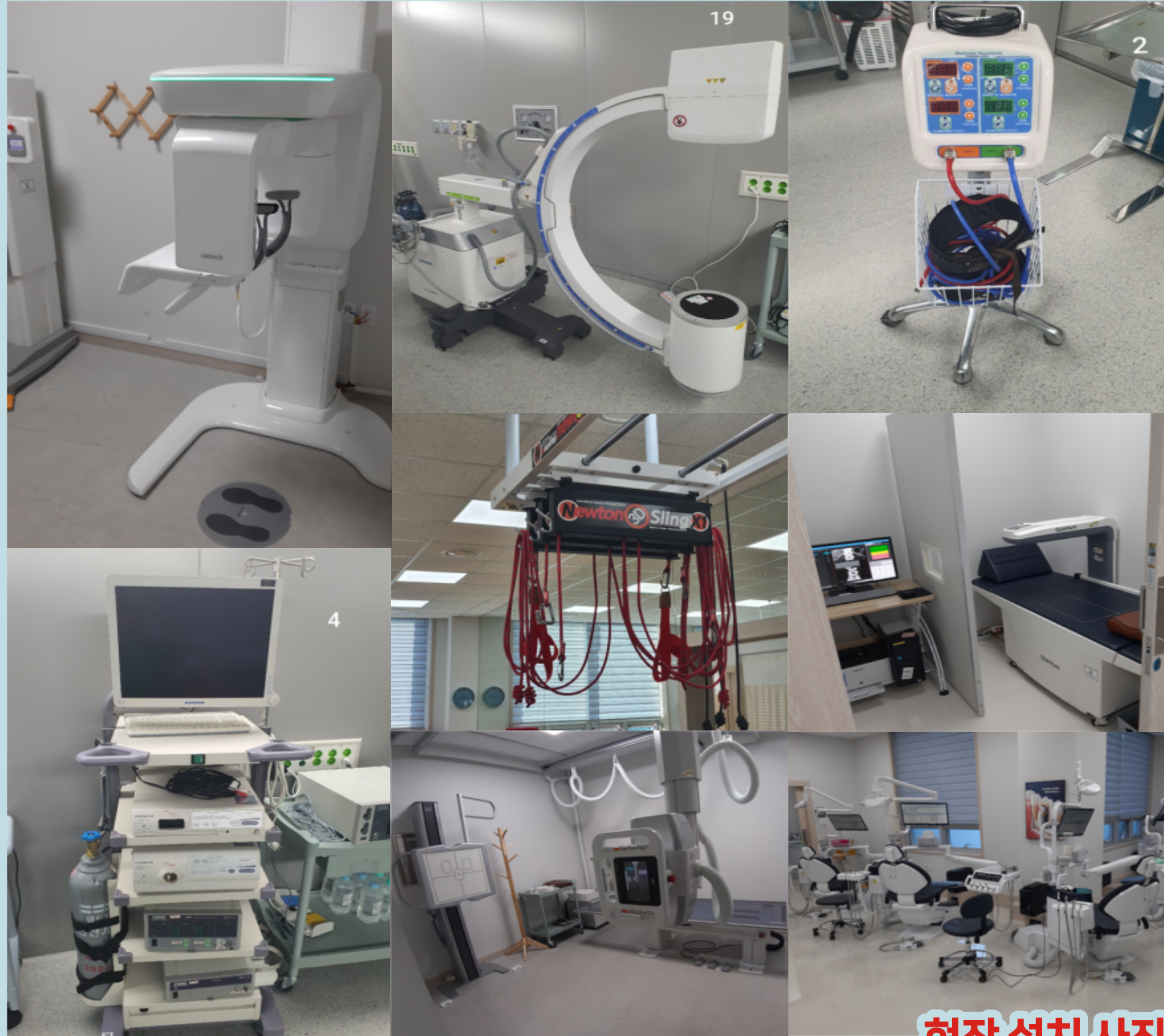
현장 설치 사진