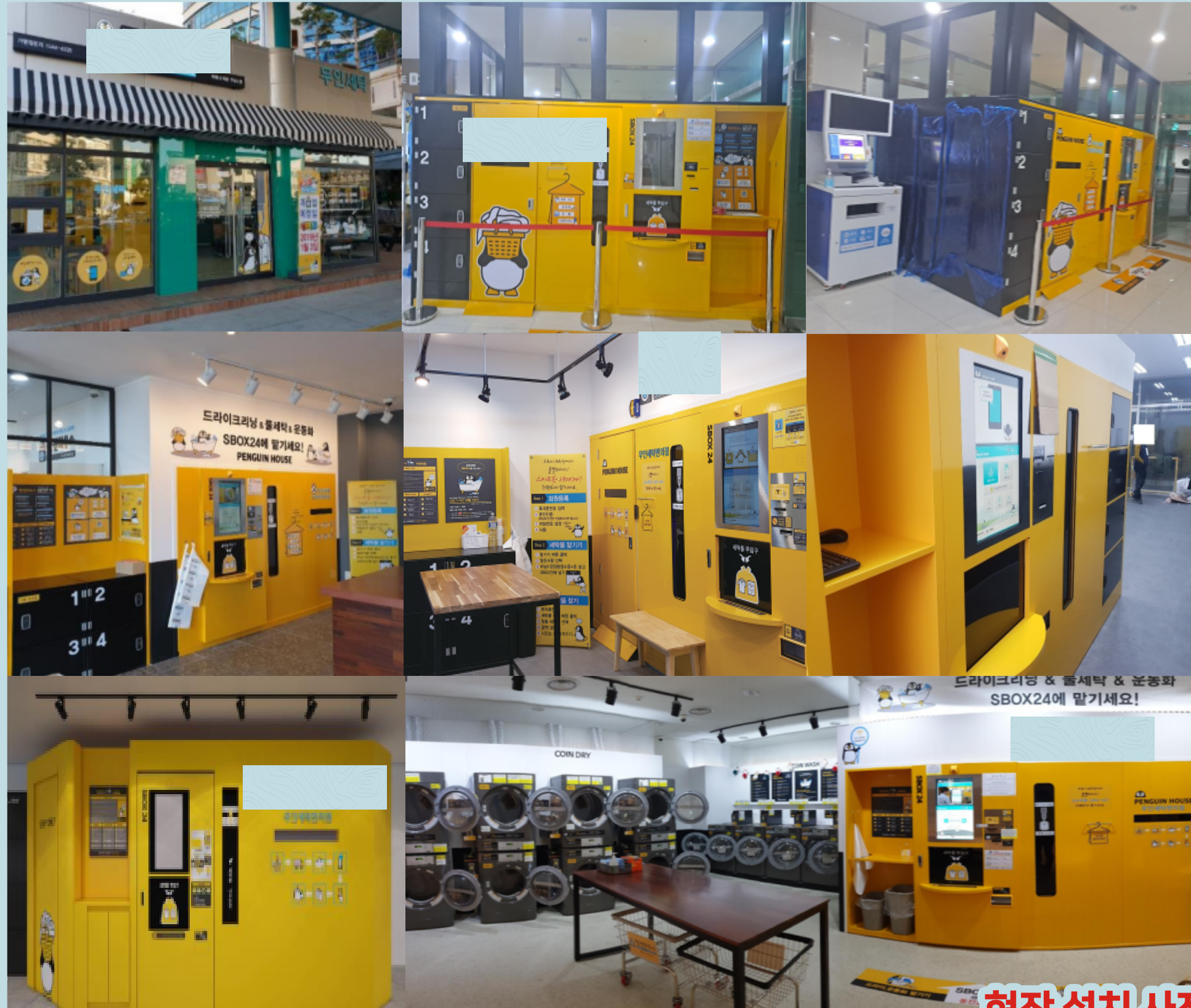
현장 설치 사진