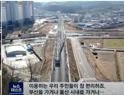
9월 개통 사실상 확정..KTX-이음 3개 역 정차 (2021.02.02/뉴스데스크/울산MBC)