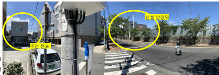
(사진 3) 중간지점에서 촬영한 파노라마 사진