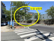
(사진 2) 추천 점포 주차장에서 촬영한 현재 공사 진행중인 신설 남창역