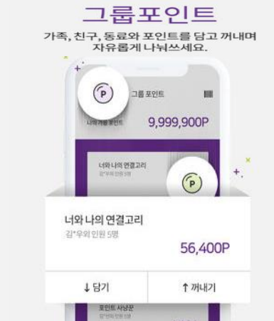
▲ BGF 리테일 CU 어플 내에서 실제로 제공하는 그룹 포인트