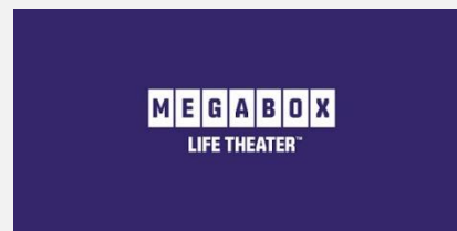
2018. 10. 메가박스 “메가박스 플래그십 사이트 육성을 위한 프로모션 아이디어 제안”