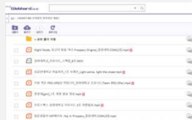
학회별 발표 영상을 웹하드에 업로드