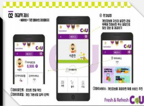
▲ 산학협력시 IBS에서 제안한 내용