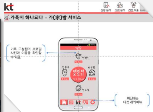
▲ 산학협력시 IBS에서 제안한 내용