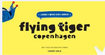
2018. 10. 플라잉타이거코펜하겐 “한국에서의 브랜드 마케팅 전략 아이디어 제안”

IBS는 매 학기 다양한 기업들과 IDEA COMPETITION 형식의 산학협력 프로젝트를 진행하여 기업과 학생이 상호 발전 을 이룰 수 있는 건설적인 교류를 이루어 나아가고자 노력하고 있습니다.