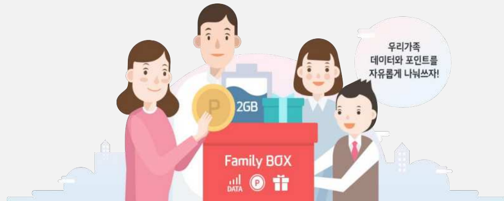
▲ Olleh KT에서 실제로 제공하고 있는 가족 결합 상품