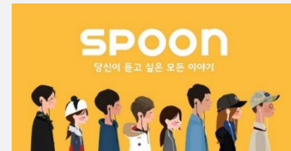
2019.05. 스푼 라디오 “브랜드 마케팅 전략 아이디어 제안”