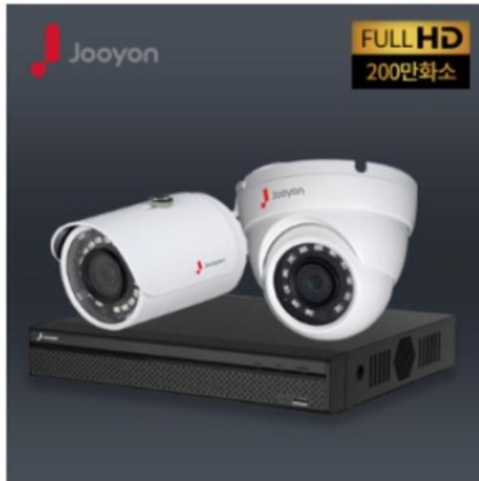
200만화소 패키지 118,000원