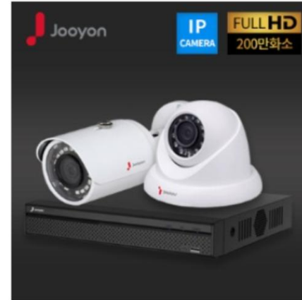
IP200 만화소 패키지 373,000원