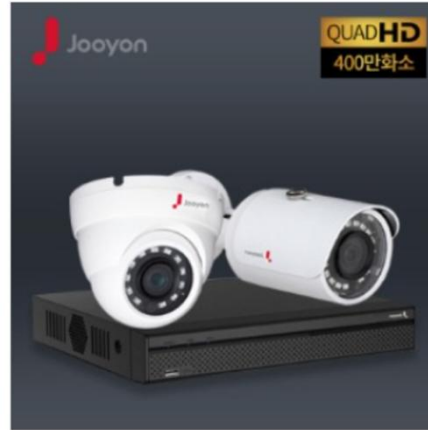
400만화소 패키지 285,000원