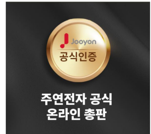
온라인 총판가 혜택으로 수량 제한이 없음