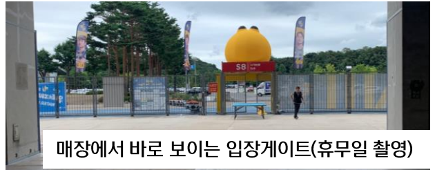
매장에서 바로 보이는 입장게이트(휴무일 촬영)

매장이 위치한 지상1층을 통해서만 관중 입장 가능 (총 6개 게이트 운영)