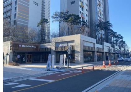
◎ 3블록 A동