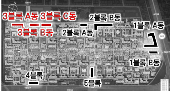
◎ Keymap _상가위치