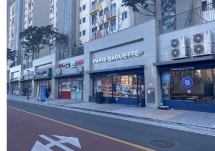
◎ 3블록 B동